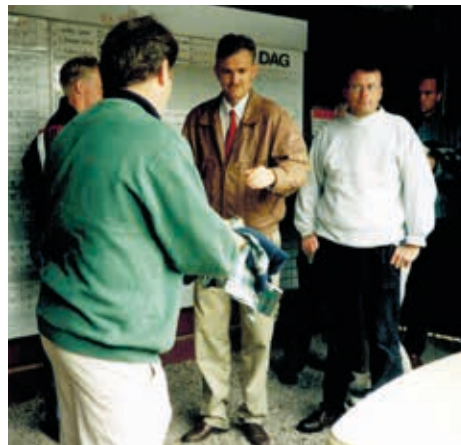
■ Prisutdelning på en företagsgolf.