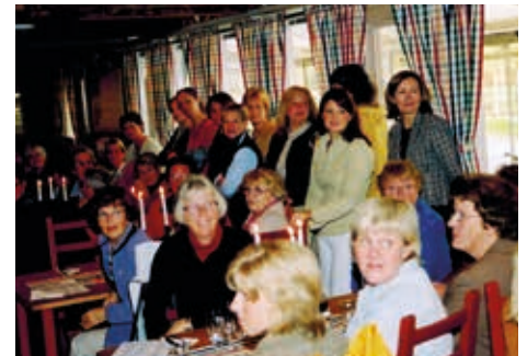
■ En välbesökt damupptakt.