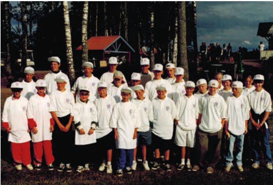
■ En härlig samling unga golfare.

Dalsjö Golf & Business Club firar 20 år med extra aktiviteter.