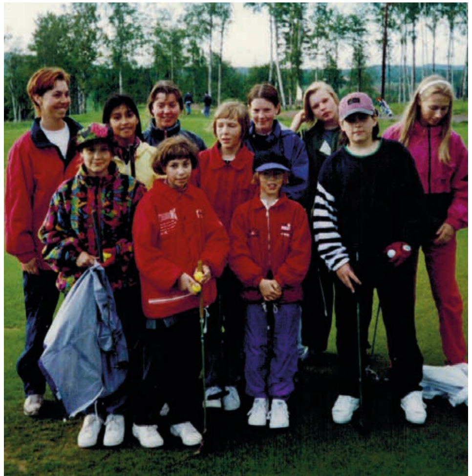
■ Ett glatt Green Team gäng.