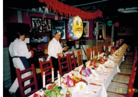
■ Inte bara nio-hålsfika och luncher på Dalsjö Krog utan även kräftska.